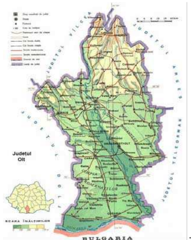
Figura 1: POZITIA GEOGRAFICA A PROIECTULUI

Judetul Olt se afla situat in Regiunea de dezvoltare 4 Sud-Vest Oltenia. Din punct de vedere administrativ, judetul Olt este compus din 2 municipii (Slatina si Caracal), 6 orase (Bals, Corabia, Draganesti Olt, Piatra Olt, Potcoava si Scornicesti) si 104 comune.